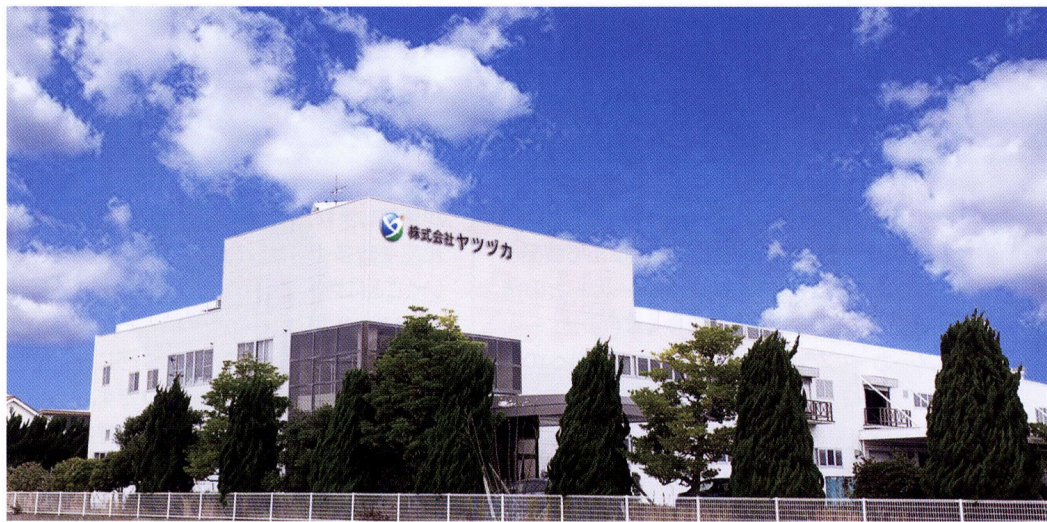
▲2300坪の用地に本社屋を新築し従来の3拠点を一か所に統合