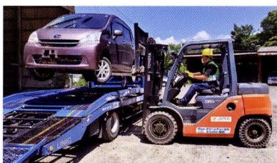
▲災害時の車両引き上げ対応